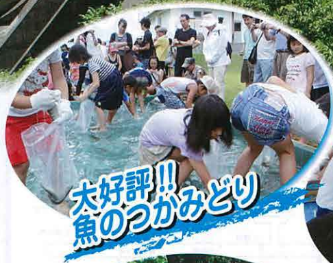
大好評!! 魚のつかみどり