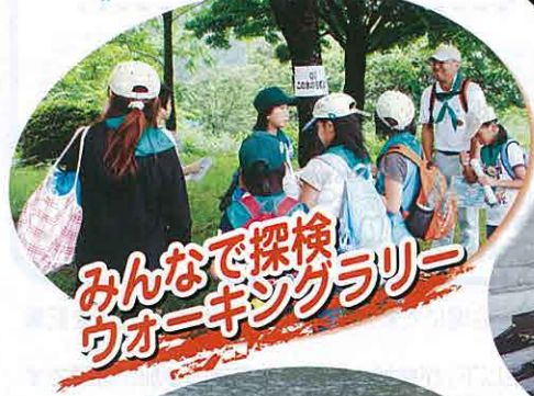
みんなで探検 ウォーキングラリー