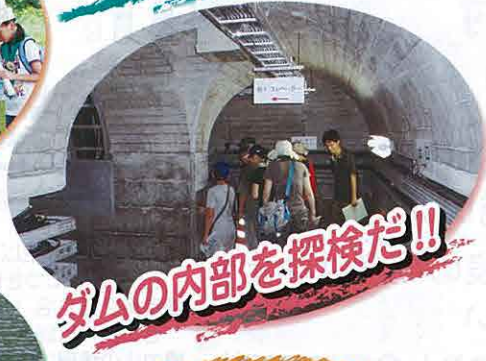
ダムの内部を探検だ!!